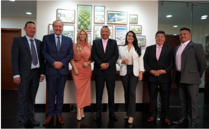
Comisión negociadora Grasco

DESDE NUESTROS TERRITORIOS LO QUE PASA, DONDE TODO PASA