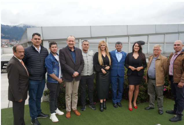
Comisión negociadora Raza